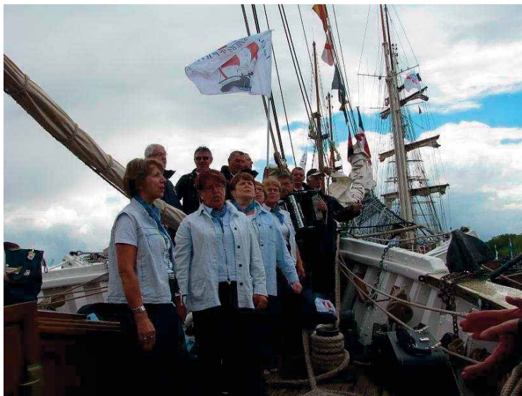
Les Cap'Horniers de la Rance

Pour le KIG HA FARZ , qui a été un énorme succès en 2010 (400 repas servis), il est fortement conseillé de réserver à l'avance, car l'année dernière nous avons malheureusement dû refuser du monde.